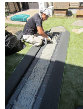
ジョイント部に接着剤を塗布する様子